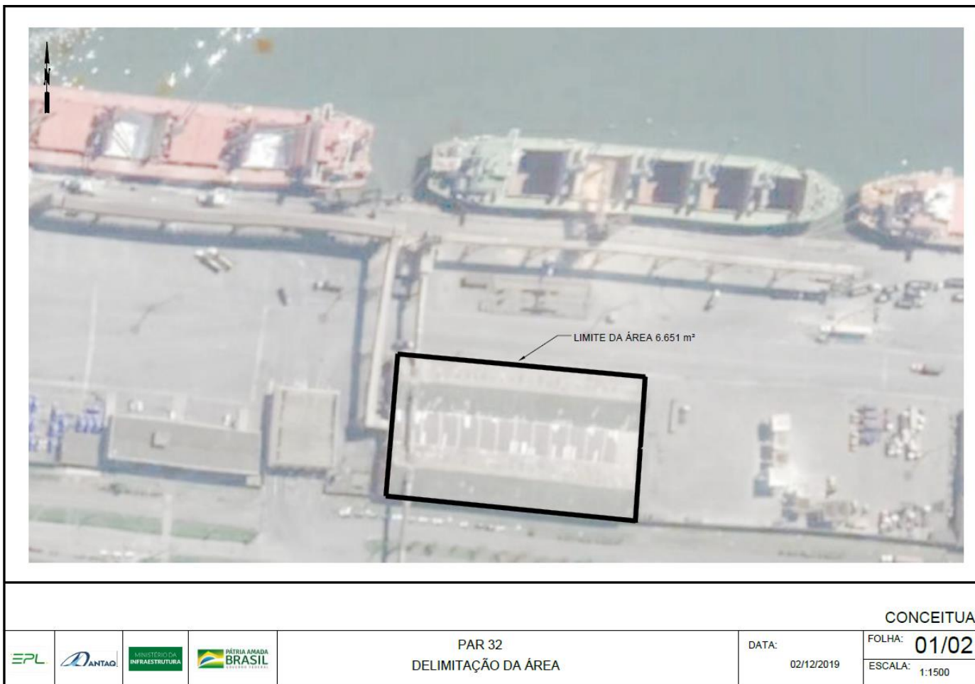
Anexo C-1: Figura 1 – Delimitação da Área