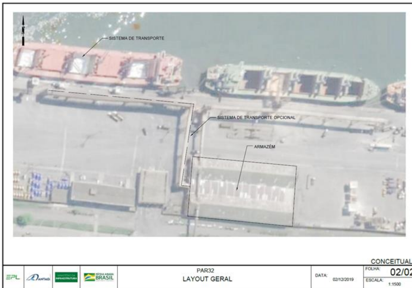
Anexo C-1: Figura 2 – layout Geral